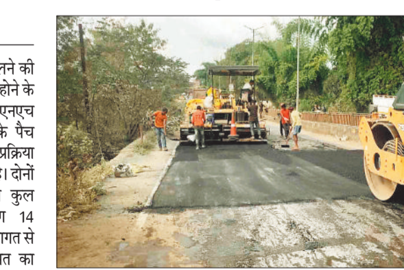
पैच रिपेयरिंग का काम शुरू किया गया।

शहर को जर्जर सड़कों से अब मुक्ति मिलने की उम्मीद जगी है। बारिश का मौसम समाप्त होने के बाद शहर के बीच मौजूद लोनिवि और एनएच की सड़कों के पैच रिपेयरिंग की प्रक्रिया शुरू कर दी गई है। दोनों ही विभागों द्वारा कुल मिलकर लगभग 14 करोड़ रुपए की लागत से सड़कों के मरम्मत का कार्य किया जाएगा। इसमें जिले के साथ ही संभागभर में आने वाले वाली एनएच की प्रमुख सड़कों भी शामिल है। इस बीच लोनिवि ने सड़कों के मरम्मत का कार्य शुरू कर दिया है। सरगुजा में इस बार मानसून में जमकर बारिश हुई। समय से पहले पहुंचे मानसून के कारण