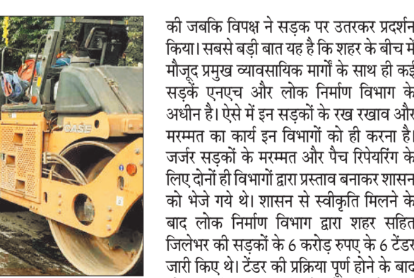
पैच रिपेयरिंग का काम शुरू किया गया।