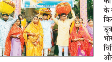
अवसर पर ब्रतियों द्वारा खरना प्रसाद ग्रहण और वितरण किया गया। छाल में डूबते सूर्य

कुड़ेकेला। छाल क्षेत्र में छठ पूजा का पर्व धूमधाम से मनाया गया। छठ पूजा एक महत्वपूर्ण हिंदू पर्व है। यह पूर्व सूर्य देव को समर्पित है। धार्मिक, सामाजिक और सांस्कृतिक रूप से इस पर्व की काफी महत्ता है। यह पूर्व कार्तिक मास के छठवें दिन मनाया जाता है। रायगढ़ जिले के छाल एवं कुड़ेकेला क्षेत्र में भी छठ पूजन की सूर्य देव को अर्घ्य अर्पित किया गया। इस